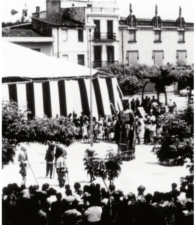
Envelat del Centro i ball de gegants i capgrossos d'una Festa Major dels anys 60.

Als anys quaranta només se'n fa un, el del Círculo Recreativo -abans de la guerra, Centre Republicà-. En una entrevista de l'any 1945 a Llumiguia recordant la Festa de 1920, es diu que hi havia hagut dos envelats de forma cònica molt més elegants que els que havien muntat aquell any. A l'any 1954 la Unió Deportiva Cassà reivindica poder muntar el seu envelat. Des d'aquest moment i durant la dècada dels 60 es mantenen els dos envelats que organitzen les entitats UD Cassà -el futbol- i el Círculo Recreativo -el Centre- competint entre elles per veure qui aconseguia portar les millors orquestres: Selvatana, Principal de La Bisbal, Amoga, Meravella, Caravana, Principal de Cassà. Serà fins el 1970, últim any que el Centro va muntar l'envelat a la plaça de la Coma enganxat a la paret de l'edifici i on es deixarà de fer el ball vermut dels migdies de la Festa Major. A partir d'aquest moment i fins l'any 1982, l'envelat de la Festa Major l'organitza únicament la Unió Deportiva Cassà. Serà un envelat llogat a les empreses Crous i Barris de Salt, com s'havia llogat en altres ocasions als Dalmau de cal Noi Martí de Cassà o als Torres de la Bisbal. L'envelat del futbol va passar per diferents ubicacions: canto-