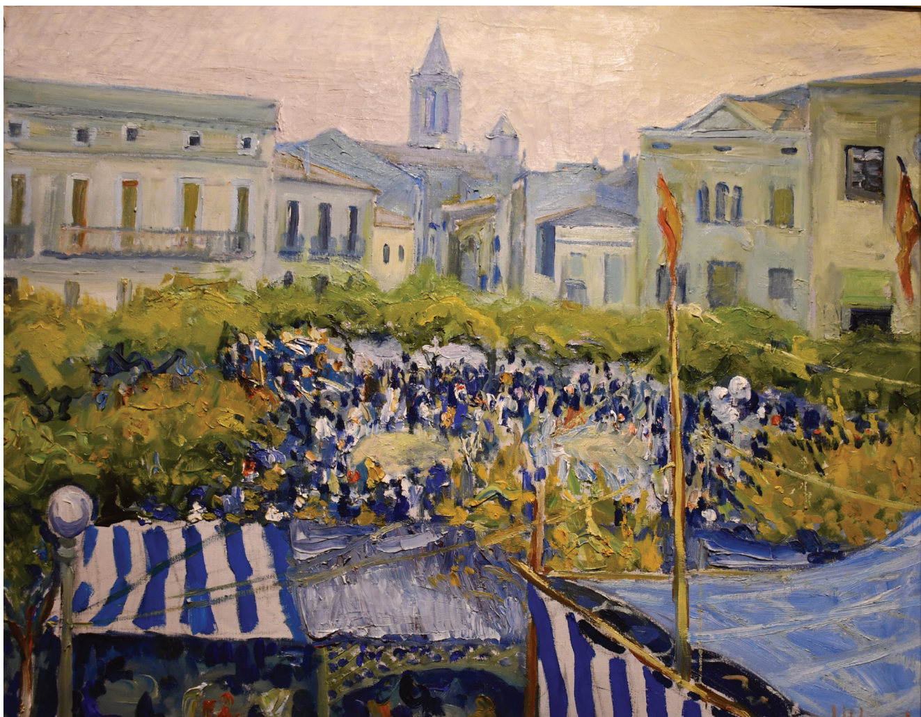
Envelat del Centre Recreatiu a la plaça de la Coma. Pintura de Joaquim Almeda d'inicis dels anys 60 del segle XX.

NOVEMBRE 2025 27 COORDINACIÓ: DOLORS RUBIROLA I SITJAS