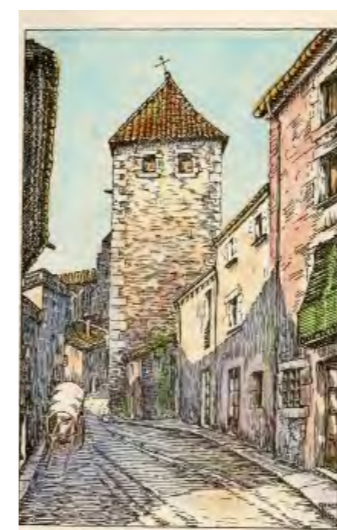
Dibuix de la torre Selvana