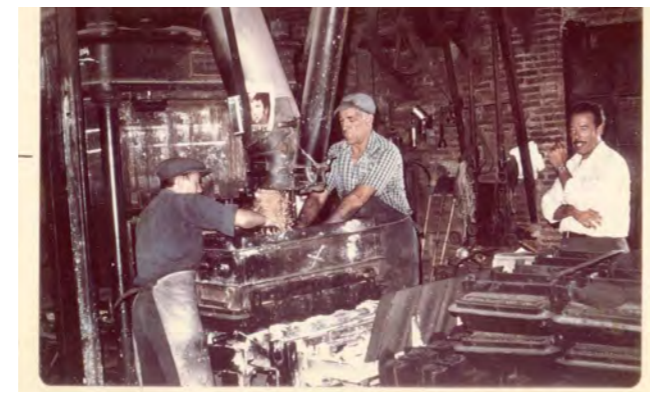
Fàbrica Rodà als anys 60 del segle XX (AMCS Col Fab. Rodà)

L'any 1967 es va inaugurar l'aeroport Girona-Costa Brava, i l'any passat es varen celebrar els 50 anys de l'efemèride. Tres anys abans