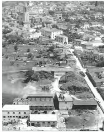
Vista general de la fàbrica Reliàble (Reliàble S.A.)

És el nombre de tallers amb activitat suro-tapera declarats l'any 1920 en el nostre municipi. Aquesta xifra és d'una dècada més tard dels coneguts com "els 30 anys d'or del Cassà surer" que varen estar compresos entre el 1880 i el 1910.