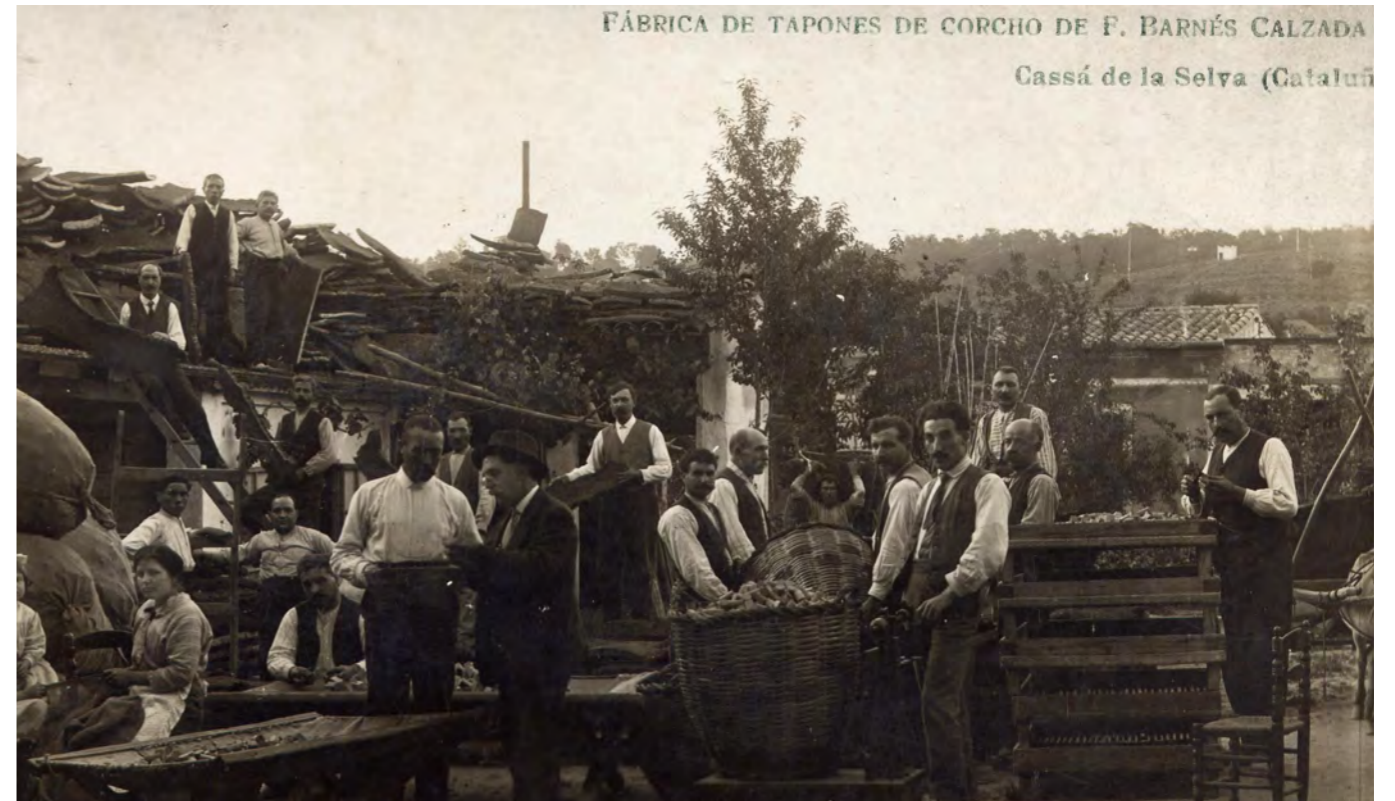
Fàbrica Frederic Barnés a primers de segle XX

COORDINACIÓ: Arxiu Municipal de Cassà de la Selva