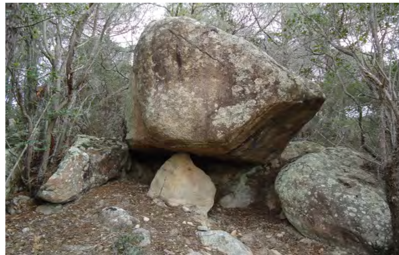
Roca de les Tres Rases

COORDINACIÓ: Arxiu Municipal de Cassà de la Selva