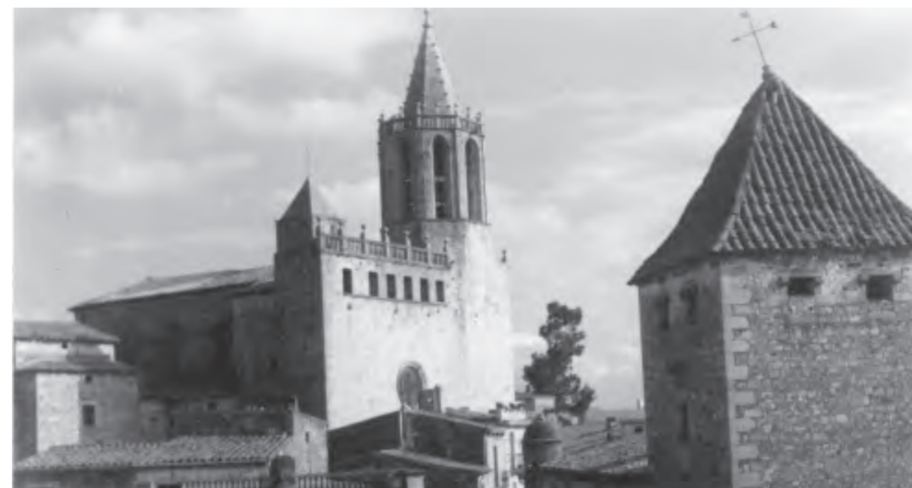
Vista de l'església de Cassà i la Torre Salvana, a la dècada de 1950

ABRIL 2015 3 COORDINACIÓ: Arxiu Municipal de Cassà de la Selva