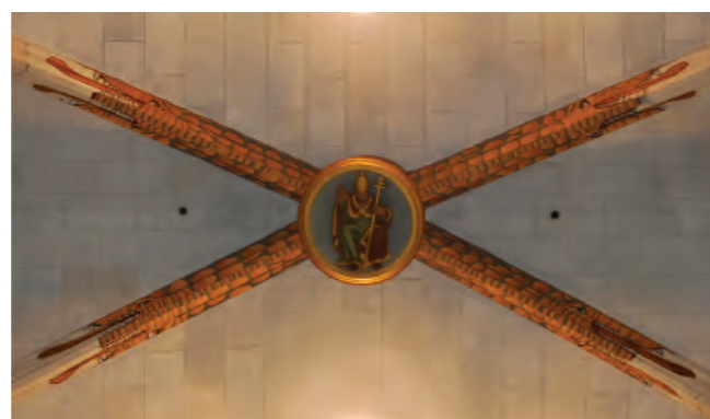
(Autor: Xavier Albertí)

Durant la restauració de l'església l'any 2005, van sortir a la llum unes pintures de dracs serps a la volta de la nau central. Aquest fet va ser una sorpresa per a molta gent, ja que gairebé no es veien. No sabem amb exactitud quan van ser pintats. Tenim constància que l'any 1787 "se ha emblanquinat la Iglesia, renovant les pintures y donat color als arcs" a càrrec d'un emblanquinador i un pintor italià, cosa que hi podria tenir a veure. El seu significat també és confús. Podria tractar-se d'un símbol de dominació de les forces salvatges o ser utilitzats com a guardians dels tresors. Encara queda molt per conèixer sobre els dracs-serps de la nostra església.