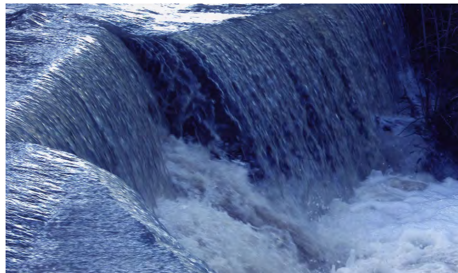
Revinguda a la Verneda (Concurs de fotografia naturalista. Autor: J.M.Fusté)